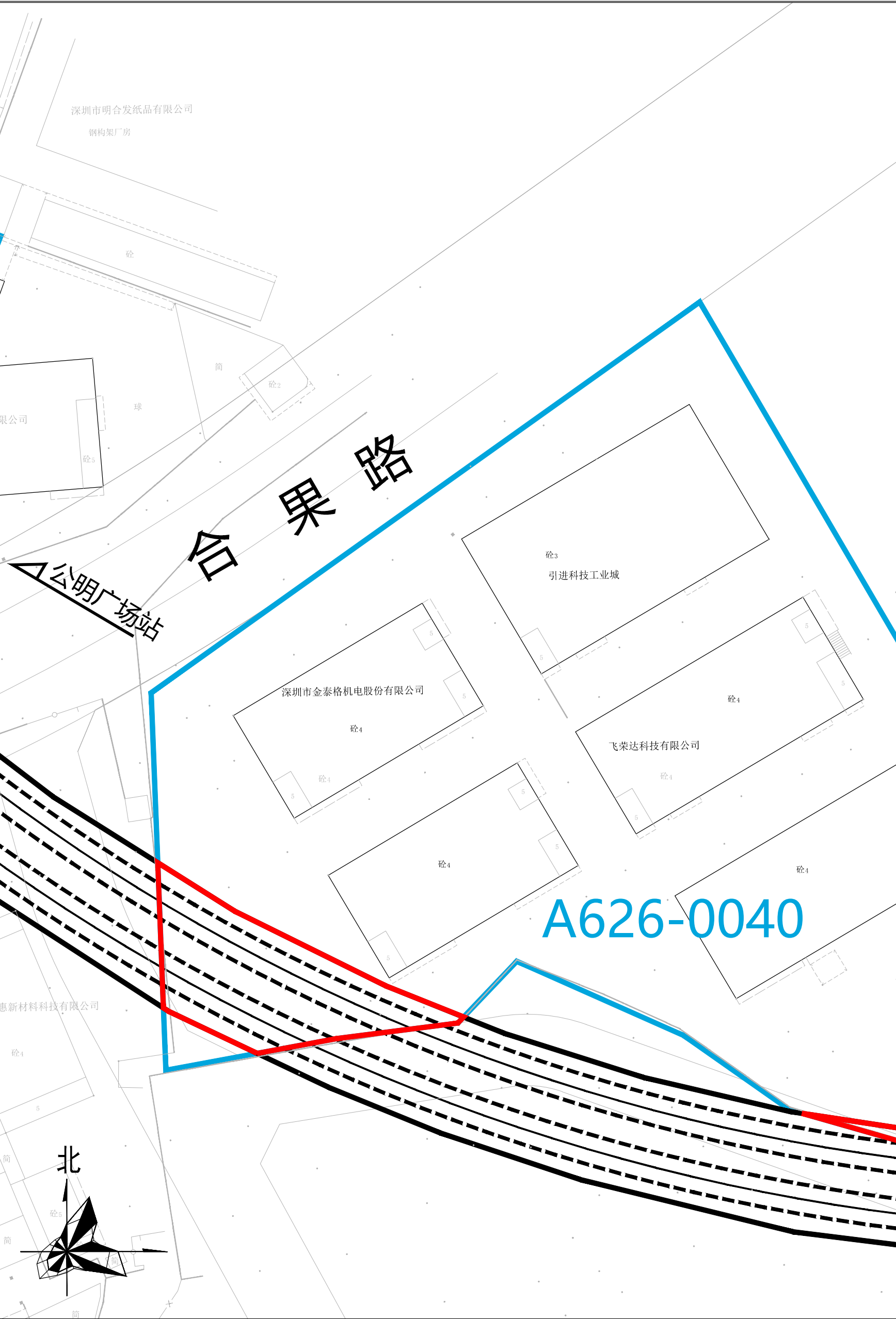
规划轨道交通13号线二期工程与A626-0040宗地相交关系平面图